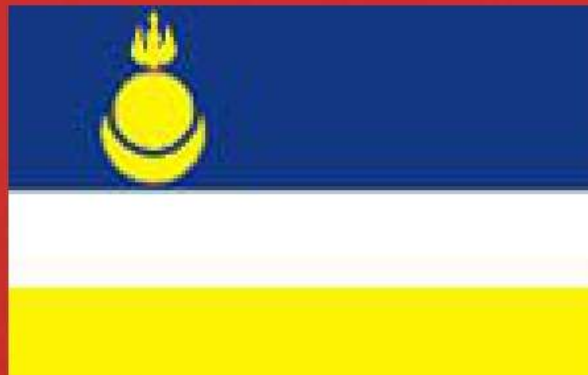
Национальный флаг Республики Бурятия